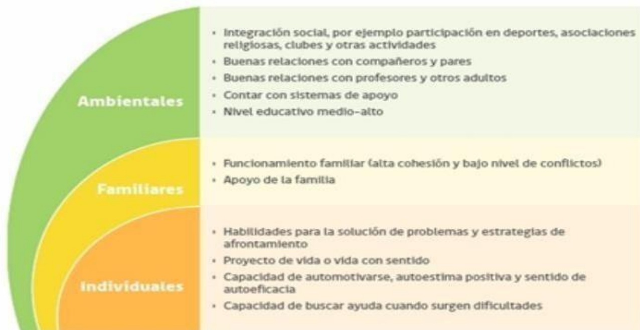
FIGURA 2. FACTORES PROTECTORES CONDUCTA SUICIDA EN LA ETAPA ESCOLAR